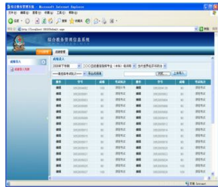
图 1 综合教务管理信息系统成绩导入导出页面

基于上述原理, 我们很容易实现某院校“综合教务管理信息系统”中“成绩导入导出”模块的功能。如图 1 所示: